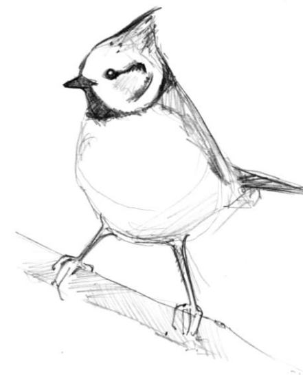
Mésange huppée – croquis Nicolas Berne